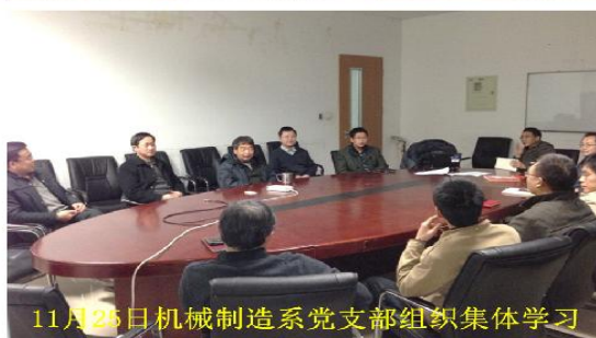
11月25日机械制造系党支部组织集体学习

随后，按照学院党委工作部署，各党支部分别在新主楼 B111、B402、A312 等会议室以党支部为单位分头组织学习活动，党员们逐条学习了两部法规，重点讨论了六大纪律，表示要在日常工作、生活