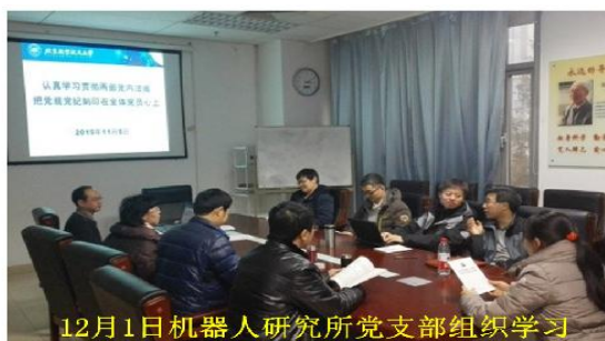
12月1日机器人研究所党支部组织学习