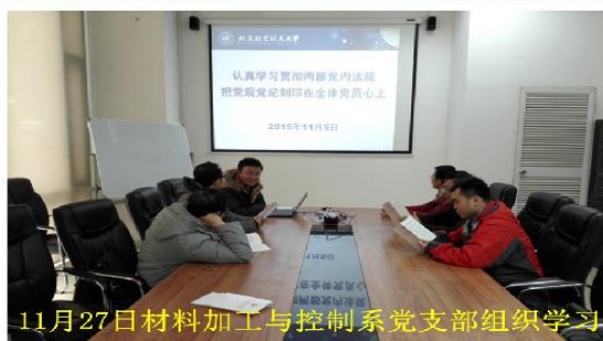
11月27日材料加工与控制系党支部组织学习